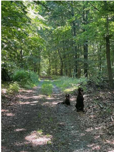
Kurze Gassi-Runde (●)