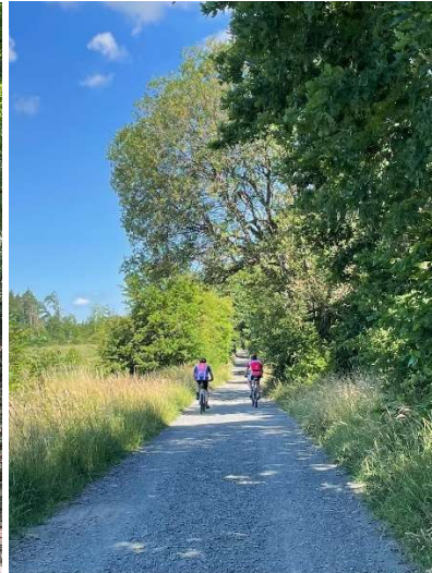
Lange Gassi-Runde (●)